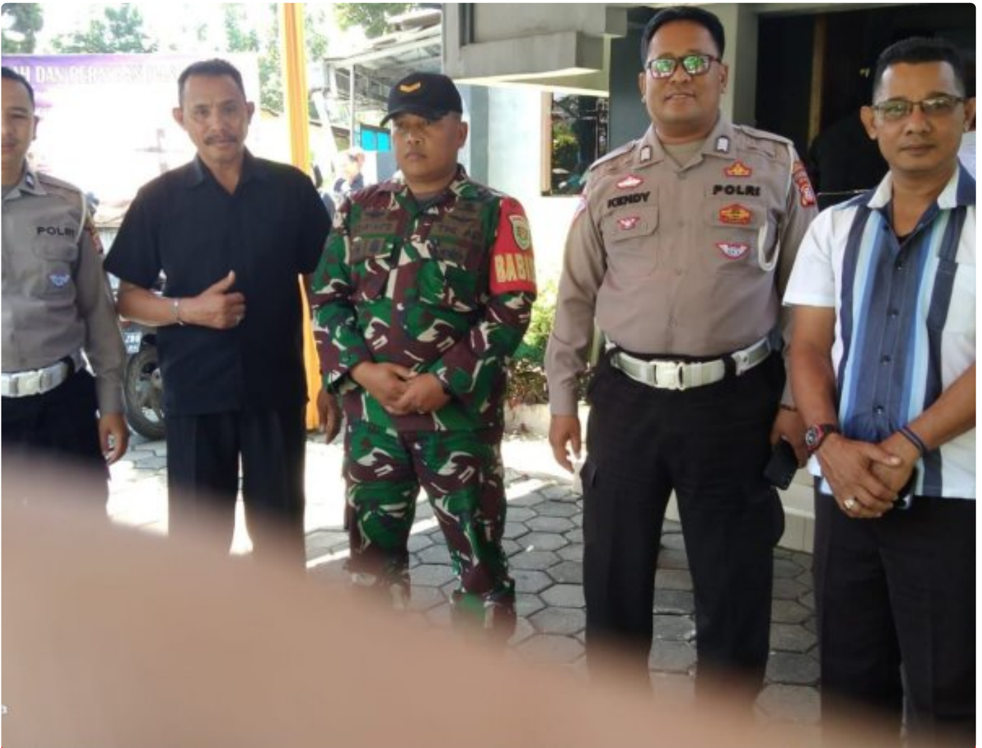
TNI dan Polri Lakukan Pengamanan Ibadah Jumat Agung, jumat 29 maret 2024

DAYEUKOLOL - Personel Polsek Dayeuhkolot bersama personil TNI dari koramil 2407 melakukan pengamanan DI gereja GPIB PNIEL YUDHA WYOGRHA di wilayah Kecamatan Dayeuhkolot, dalam rangka ibadah Jumat Agung, Jumat (29/3/2024)